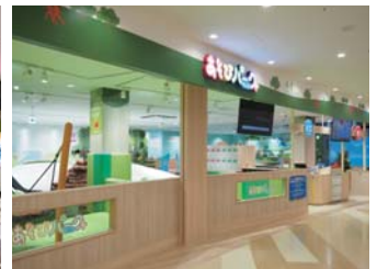
あそびパークPLUSマークイズ福岡ももち店