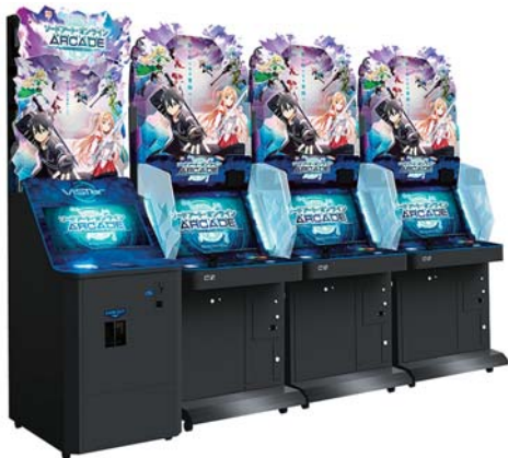
©2017 川原 礫/KADOKAWA アスキー・メディアワークス/SAO-A Project ©BANDAI NAMCO Amusement Inc.

「ソードアート・オンライン」シリーズに登場するキャラクターたちを操作して、ダンジョンを探索しながら次々と現れる敵をなぎ倒す爽快アクションと、探索で手に入れたアイテムを用いた自由で奥深いパーティカスタマイズが魅力の探索アクションRPGです。入手したキャラクターやアイテムはリアルカードに印刷することも可能で、「ソードアート・オンライン」の世界観に浸りながら、登場キャラクターのキルトやアスナたちとの果てなき冒険を楽しむことができます。3月19日より全国のゲームセンターで稼働予定です。