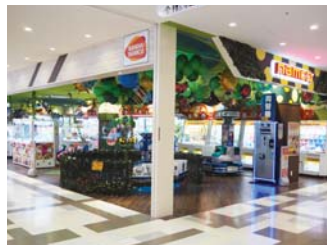
namco マークイズ福岡ももち店

「namcoマークイズ福岡ももち店」は、VRアクティビティが楽しめる「VR ZONE Portal FUKUOKA-MOMOCHI」を併設したアミューズメント施設で、VRアクティビティ「急滑降体感機 スキーロデオ」を九州で初めて導入しました。また、「あそびパークPLUSマークイズ福岡ももち店」には、バンダイナムコグループのノウハウを駆使した最新テクノロジーにより、プロジェクトンマッピングでリアルな海を再現した「屋内砂浜『海の子』」を導入しました。バンダイナムコならではの遊びを通して、お客さまに楽しい時間を提供していきます。