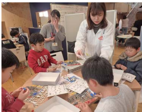
東日本大震災の被災地の子どもたちへの支援活動は現在も継続して実施している。写真は宮城県石巻市で開催した活動の様子