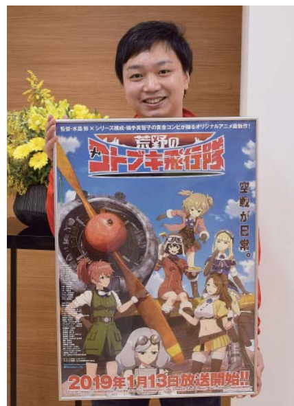
2019年バンダイビジュアル(株)(現株)バンダイナムコアーツ)入社。映像マスターの制作部門を経て、2013年より現職。「ウルトラマン」シリーズや「プリンセス・プリンシパル」を担当。

を出し合い、コンテンツを完成させ、盛り上げていくことができる——それがバンダイナムコグループの強みだと思います。「荒野のコトブキ飛行隊」でも、スタッフ一同、引き続き心をつなげて取り組んでいきますので、どうぞご期待ください。