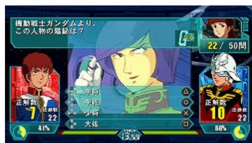
ゲーム画面 (原作のキャラクターと音声で出題)

相手の陣地は、自分の陣地で挟むとオセロのように自分のものができるため、クイズに対する知識と戦略性が勝敗を左右します。