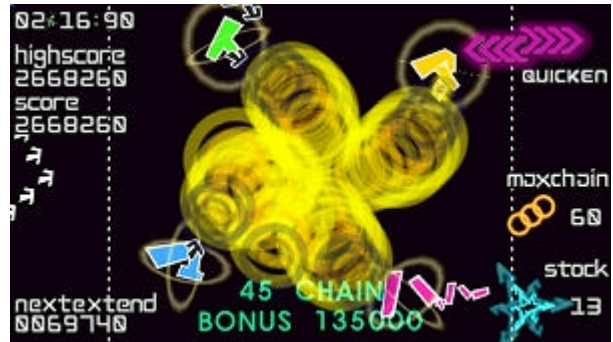
ゲーム画面 (マイアヒドライブ)

本作には、「qb」、「USCUS」( anoyo ) 「h.ueda」といった音楽業界で活躍している豪華アーティストたちが楽曲を提供しています。ゲームのBGMにとどまらないクオリティの高いサウンドが楽しめます。また、シークレットステージの「マイアヒドライブ」では、2005年のメガヒット楽曲「恋のマイアヒ」のオリジナルリミックス版を収録しました。