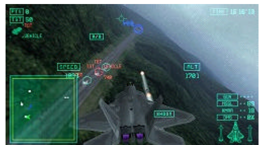
ゲーム画面（キャンペーンモード）

その結果、自らの選択が戦局に大きな影響を与えていく“エースパイロット体験”が実感できます。