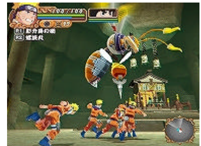
ゲーム画面 (爽快忍術アクション)

バンダイナムコゲームスは、世界中の人々に感動と豊かで楽しい時間を提供し続けるため、あくなきチャレンジを続けます。