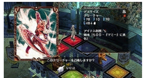
ゲーム画面 (クリーチャー召還画面)

プレイヤーの止まった土地（マス目）が空白地の場合、“ブック”からクリーチャー（モンスター）を呼び出して占領し、自分の土地にすることができます。他のプレイヤーの領地だった場合は、その土地に応じた魔力（ポイント）を支払うか、クリーチャーを呼び出してバトルを行うかを選択。バトルに勝利すると止まった場所を自分の土地にすることができます。