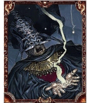
カードイラスト 作画：寺田 克也氏 カード名：ヘルティック

Xbox のネットワーク機能「XboxLive」を使用して、最大 4 人でのオンラインバトルが可能です。即座に対戦相手を見つけられる「クイックマッチ」や、あらかじめ編集された“ブック”を使用し、初心者でも手軽に遊ぶことができる「シールド戦」など、多種多様な方法やルールで遠方のプレイヤーと楽しむことができます。