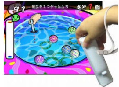
ゲーム画面 （“こより”でヨーヨー釣り）

Wiiリモコンを“コルク鉄砲”に見立てて操作します。照準を定めて、ボタンを押して景品を撃つ射撃ゲームで、いろいろな景品が獲得できます。