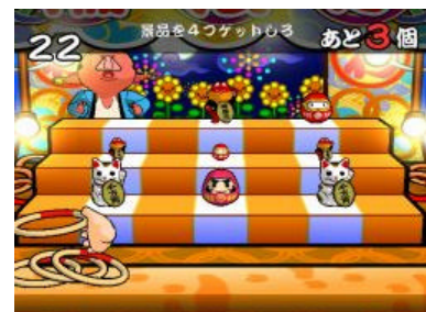
ゲーム画面（輪投げ）