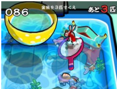
ゲーム画面（金魚すくい）

Wiiリモコンとヌンチャクの先端をつき合わせることで、“一本の長い風船”に見立ててプレイします。曲に合わせて風船を折ったりひねったりすることで、バルーンアートを作ります。協力プレイでは、一人のプレイヤーはWiiリモコンを、もう一人のプレイヤーはヌンチャクを使い、呼吸を合わせて折ったりねじったりしてバルーンアートを作り上げます。