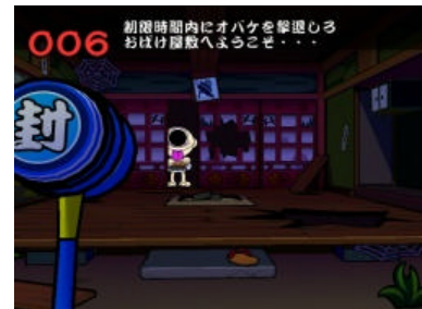
ゲーム画面（お化け屋敷）

各屋台を遊んでいくと「お化けカード」がもらえます。全屋台のカードを集めるとお化け屋敷に行けるようになります。お化け屋敷の中ではプレイヤーは自動的に移動していきませんが、お化けが出たら両手のピコピコハンマーでお化けを叩いて退治します。協力プレイも可能です。