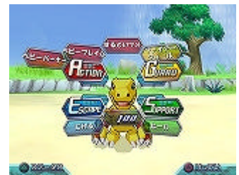
ゲーム画面 (エモーショナル・コマンド・システム)

戦闘時にパートナーの『デジモン』の気持ちがコマンドになって表れます。攻撃したいのか逃げたいのかなど意志のコマンドは多岐にわたり、数多く表示されたコマンドほど『デジモン』気持ちを大きく表します。パートナーの意志を汲み取ったコマンドの選択が戦闘の勝敗を左右します。