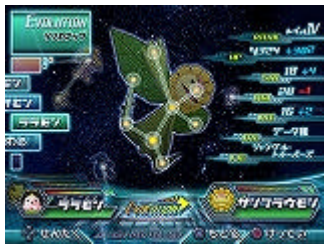
ゲーム画面 (ギャラクティカ・エヴォリューション・システム)

『デジモン』の進化の状態は『デジモン』を模した星座によって表されます。戦闘結果やイベントのクリア状況など、プレイヤーが、設定された一定の条件を満たすと星が光り、必要な数の星を光らせると『デジモン』は進化を遂げます。