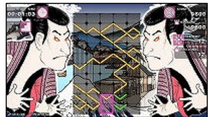
ゲーム画面 (パネル消去時の華やかな演出)

パネルは一定のペースで下からせり上り、ラインの描かれたパネルが画面上部に達するとゲームオーバーになります。