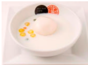
フォーチュンイースター 480円

季節のフルーツとカスタードを挟んだサクサクのパイを、甘さ控えめの生クリームで包みました。イースターのシンボル“卵”のようなかたちをした、お二人でも召し上がれるボリュームのあるスイーツです。