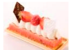
スイーツフォレスト限定メニュー