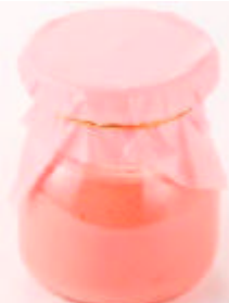
白金いちごプリン 340円

焼き立ての香ばしいクレープ生地の中にイチゴ、キウイ、ゼリーと、イチゴ風味の生クリームがたっぷり入っています。仕上げにメープルシロップとイチミツをかけていただくイチゴの風味が春の訪れを感じさせる一品です。