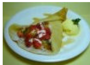
ハピネスクレープ 800円

焼き立ての香ばしいクレープ生地の中にイチゴ、キウイ、ゼリーと、イチゴ風味の生クリームがたっぷり入っています。仕上げにメープルシロップとイチミツをかけていただくイチゴの風味が春の訪れを感じさせる一品です。