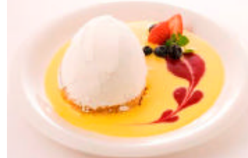
イースターエッグ 800円

季節のフルーツとカスタードを挟んだサクサクのパイを、甘さ控えめの生クリームで包みました。イースターのシンボル“卵”のようなかたちをした、お二人でも召し上がれるボリュームのあるスイーツです。