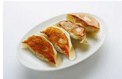
ハルピン餃子(1人前)

中国のハルピンで店主が自ら買い付けた漢方や香辛料を、季節に合わせて餡にブレンドし、健康面に配慮した本場中国の餃子ならではの深い味わいが楽しめます。その他、ホタテのぶつ切りを餡にふんだんに盛り込んだ『ホタテ餃子』(420円)や、中に仕込んだチーズと肉汁の織り成す新しい風味がクセになる『チーズ餃子』(420円)なども販売。