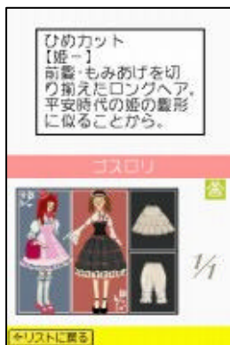
ゲーム画面 (ゴスロリ図鑑)