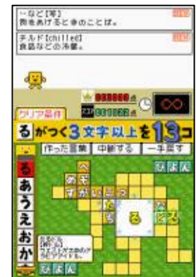
ゲーム画面 (ひとりでパズル)

通常の学習用辞書2冊分に相当する10万語以上の言葉を収録したオリジナルの辞書を搭載。一般的な言葉からあまり知られていない言葉や、「イナバウアー」や「ちょいわる」といった流行語まで多種多様な言葉を収録しました。また、作った言葉の「意味」が表示されるので、遊びながら言葉の意味を知ることができます。