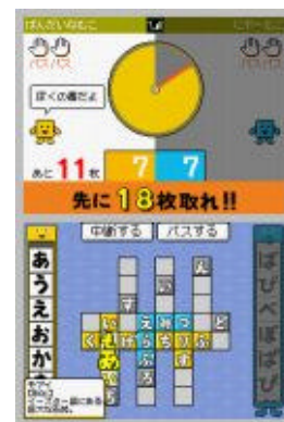
ゲーム画面 (ふたりで対戦)