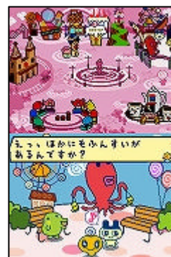
ゲーム画面 (3人でパーティを組んで大冒険)

通信機能を使用してゲーム上で名刺交換ができます。名刺はゲーム中に手に入れたアイテムを貼ったり、名前やコメントを入力できるなど、オリジナルのデザインで作成できます。そのほか、ゲームソフト1本とニンテンドーDS本体を4体使用して、最大4人で遊べるミニゲームも多数収録しました。友達と一緒に熱い対戦を楽しむことができます。