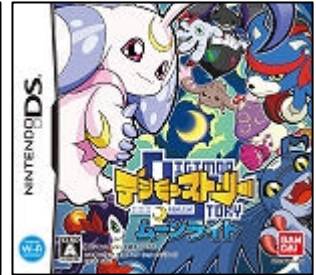
パッケージ (ムーンライト)

また登場する『デジモン』はゲームオリジナルを含む総勢 400 体以上を収録。『サンバースト』『ムーンライト』それぞれのソフトでパートナーとなるデジモンが異なるほか、入手しやすい『デジモン』も異なるので、プレイヤーは『デジモン』のコレクションも楽しむことができます。