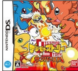
パッケージ (サンバースト)

2006年に発売した前作の『デジモンストーリー』でも好評いただいた、自動的にデジモンを育成する『デジファーム』や迫力の戦闘システムは今作でも健在。また新たに追加されたファームの情報を確認できる『ティマーホーム』機能により前作以上に育成状況が把握し易くなりました。