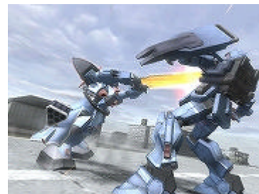
ゲーム画面 (スペシャルアタック)

ダイレクトアタック(格闘モード)で、プレイヤーと敵が同時に格闘攻撃を行うと、「つばぜり合い」になります。Wii リモコンを多く振って敵に打ち勝つと、通常より攻撃力が高く、3人称視点でダイナミックな演出を行うスペシャルアタックが発動します。また、ガード状態時に敵の攻撃に対して、Wii リモコンをタイミングよく振ると、カウンターでスペシャルアタックによる反撃を行います。