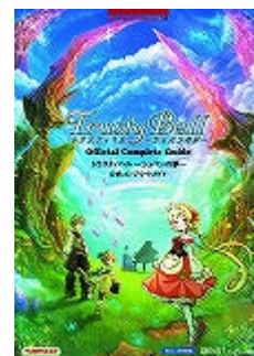
攻略本カバーイラスト(仮)