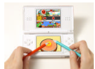
ゲーム画面 (バチペンで演奏)

一定時間相手の演奏を邪魔する「バクダン」などの攻撃系アイテムや、自身のスコアやコンボ数などにボーナスが加わる「大入り袋」などのパワーアップ系アイテムを使いこなせば、多人数での演奏がさらに盛り上がります。