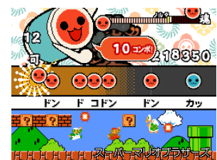
ゲーム画面 演奏曲：スーパーマリオブラザーズ