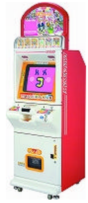
DCD「たまコン」 (C)BANDAI 2007

「データカードダス」マシンは、デジタルデータ付きカードの購入ができる自販機であるとともに、購入したカードのデータを読み込んでデジタルデータと融合した遊びを提供することができるカードマシンです。データカードダス専用のカードにはバーコードが付いており、このバーコードのデータを筐体が読み取りその情報をもとに、筐体に搭載されたゲームソフトで遊ぶことができます。