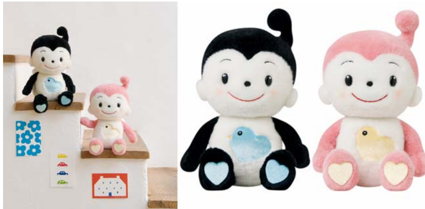
『プリモピース』（黒・ピンク／各15,750円・税込）

『プリモピース』は充実した機能を満載し、10周年を迎える『プリモプエル』シリーズの新しい仲間として、今後も人と人のココロのつながりを深めるサポートをしていきます。