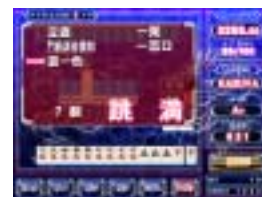
ロンファミーション