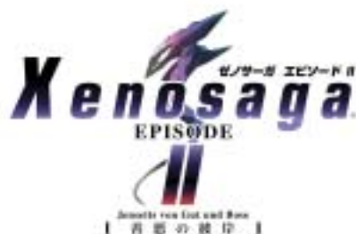
ゼノサーガ エピソード II [運命の彼岸]