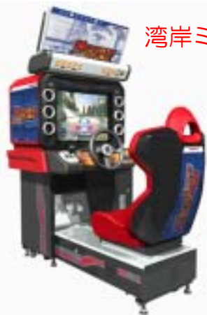
湾岸ミッドナイト マキシマムチューン