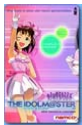
アイドルマスター